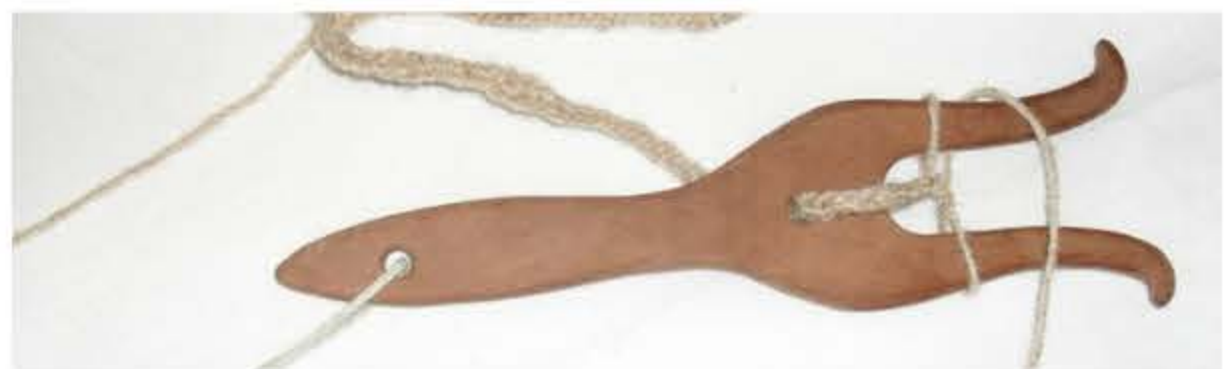
Lucette en bois Sasfridhr

La lucette (ou lucet) est un objet en bois, os ou corne , en forme de fourche servant à tresser des cordons. C'est l'ancêtre du tricotin .