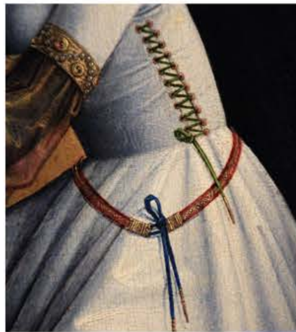
Rogier Van der Weyden, Le triptyque de la famille Braque, sainte Marie-Madeleine (détail). Paris, Musée du Louvre, vers 1450