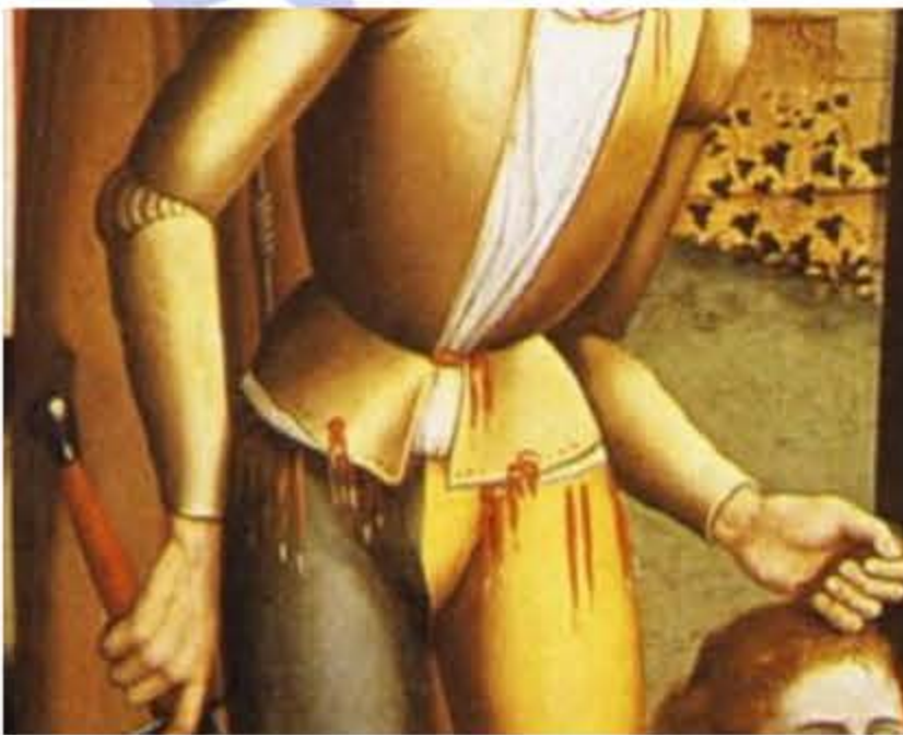
Dirk Bouts : La justice de l'empereur Otton : Le supplice du comte innocent, détail ; (ca. 1473-1475) ; Musées royaux des beaux art de Belgique, Musée d'art ancien.

Retenir des parties de vêtements : haut-de-chausses au pourpoint